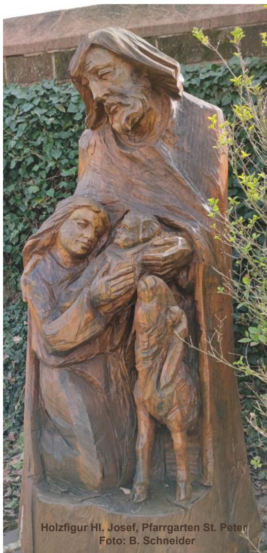
Holzfigur Hl. Josef, Pfarrgarten St. Peter